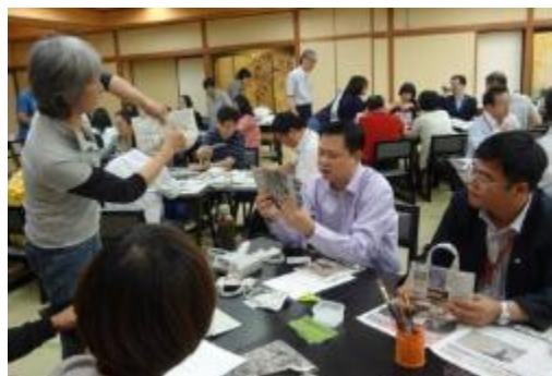
被災者支援活動の新聞バッグ作成を体験 （NPO 法人海の手山の手ネットワーク）

自然災害の脅威を目の当たりにした団員たちからは、被災地が懸命に再生に向けて取り組む姿を帰国後に広く伝えること、また震災で得た教訓を共有し、公務員の立場として生かすことが何より大切であるとの感想が聞かれた。