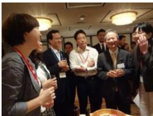
団員と歓談する江田五月 公益財団法人 日中友好会館会長（右より2）（歓迎会）